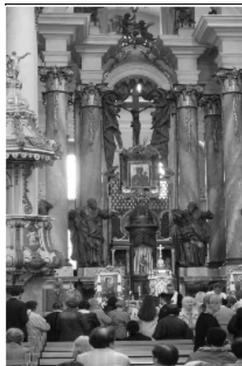
Fot. 1 Lwów – kościół p.w. Bożego Ciała, w ołtarzu głównym kopia obrazu Matki Bożej Różańcowej

Zwycięska Matka Boża Różańcowa – koronacja: 01.07.1751 r, Lwów (Ukraina), do II wojny światowej obraz wisiał w głównym ołtarzu kościoła oo. Dominikanów p.w. Bożego Ciała. Po II wojnie dominikanie zmuszeni zostali do opuszczenia Lwowa. Cudowny obraz znalazł się w Gdańsku w kościele dominikańskim p.w. św. Mikołaja. W 1994 r. w ołtarzu głównym lwowskiego kościoła umieszczono jego kopię.