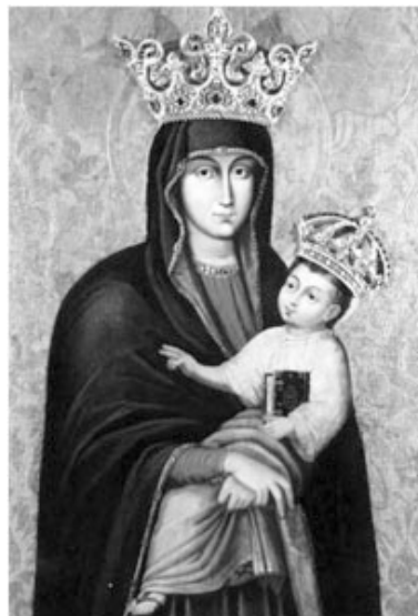
Fot. 4. Lwów – kościół p.w. św. Piotra i Pawła – Matka Boża Pocieszenia

Matka Boża Pocieszenia – koronacja: 28.05.1905 r; Lwów (Ukraina), kościół oo. Jezuitów, jeden z największych we Lwowie. Obecnie od 2011 r. kościół został otwarty jako greckokatolicka świątynia garnizonowa p.w. Ś.Ś. Piotra i Pawła. W 1946 r. Jezuici, opuszczając Lwów, zabrali ze sobą obraz do Krakowa. W 1974 r. przeniesiono go do wrocławskiej parafii p.w. św. Klemensa Dworzaka. Obraz Matki Bożej Pocieszenia ogłoszono Patronką Robotników i Solidarności .