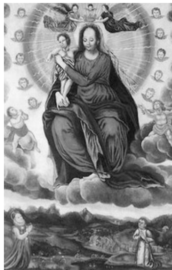
Fot. 3. Lwów – Bazylika Archikatedralna p.w. Wniebowzięcia NMP – Matka Boża Łaskawa - Śliczna Gwiazda Miasta Lwowa

Matka Boża Łaskawa nazywana Śliczną Gwiazdą Miasta Lwowa - koronacja: 12.05.1776 r; Lwów (Ukraina). Od 1765 r. znajdował się w katedrze łacińskiej we Lwowie. Obecnie jest tam kopia. Przed tym obrazem król Jan Kazimierz składał pamiętne śluby królewskie. W 1946 r. obraz przewieziony do Krakowa. W 1974 r. umieszczony w głównym ołtarzu prokatedry w Lubaczowie. W 1980 r. poddano go gruntownej konserwacji, wykonano dwie wierne kopie, oryginał złożono w skarbcu katedry na Wawelu. Pierwszą kopię wizerunku przeznaczoną do prokatedry w Lubaczowie ukoronował na Jasnej Górze papież Jan Paweł II w 1983 r., drugą do katedry we Lwowie, Jan Paweł II koronował w 2001 r. we Lwowie. Oryginał obrazu przechowywany jest jako wielka relikwia narodowa w skarbcu katedry wawelskiej, wśród szczególnie cennych pamiątek narodowych.