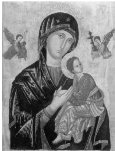
Fot. 5. Lwów – kościół p.w. Ofiarowania Pańskiego, Matka Boża Nieustającej Pomocy

Matka Boża Nieustającej Pomocy - koronacja: 25.06.1939 r, Lwów (Ukraina) Kościół p.w. Matki Boskiej Gromniczej – najstarszy katolicki kościół Lwowa. Po zakończeniu II wojny światowej Siostry Karmelitanki zostały wysiedlone ze Lwowa, zabrały obraz osiedlając się w Kaliszu. Ikona znajduje się w klasztorze Sióstr Karmelitanek, umieszczona w publicznej kaplicy.