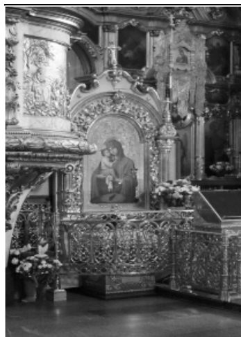
Fot. 2. Ławra Poczajowska - Matka Boża Poczajowska

Matka Boża Poczajowska - koronacja: 08.09.1773 r; Poczajów (Ukraina) Sobór Zaśnięcia Matki Bożej w Ławrze Poczajowskiej. Ikona Matki Bożej w Ławrze Poczajowskiej należy do najbardziej czczonych wśród Słowian. Sanktuarium w rękach prawosławnych. Kopia znajduje się w Warszawie u o.o. Bazylianów przy ul. Miodowej.