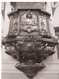
Fot. 1. Ambona w kościele o.o. franciszkanów w Poznaniu

Wnętrze nawy głównej sanktuarium franciszkańskiego, po prawej stronie, zdobi ambona regencyjna z lat 1732-33 (fot. 1) autorstwa snyczerza Szymona Betingera i malarza Gotfryda Langnera, z fundacji o. Bazylego Stęskiego. W środkowym polu pięciobocznego korpusu ozdobionego ornamentem cęgowym z kampanulami umieszczone jest uskrzydłone serce i chusta św. Weroniki z wizerunkiem Chrystusa w cierniowej koronie, a pod nią łaciński napis: „Verbum Divinum inter spinas” („Słowo Boże wśród cierni”) (fot.2). Poniżej widoczny jest zwieńczony koroną kartusz z napisem: „Suscipe insitum Verbum quo potest salvare animas vestras” („Przyjmijcie wcielonę Słowo, które może zbawić dusze wasze”). Te zdania stanowią zachętę do słuchania i przyjęcia Słowa Bożego, nawiązując tym samym do dawnej funkcji ambony, z której Je głoszono. W kontekście zbliżających się Świąt Zmartwychwstania Pańskiego warto skupić uwagę na wspomnianym wyobrażeniu chusty św. Weroniki.