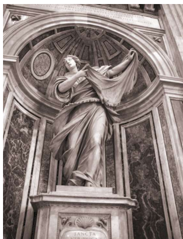
Fot. 4. Figura Świętej Weroniki w Bazylice św. Piotra w Rzymie