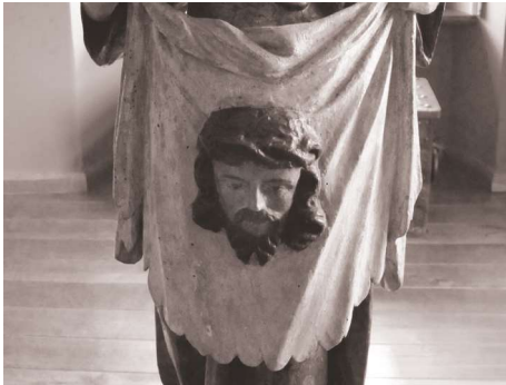
Fot. 7. Chusta św. Weroniki. Fragment rzeźby. Muzeum Archidiecezjalne w Poznaniu

Pierwsze obrazy inspirowane Chustą Weroniki określane acheiropita (acheiropoietą, achiropita) czyli „powstałe w sposób nadnaturalny” lub „nie ludzką ręką malowany”, pojawiły się w sztuce późnobyzantyjskiej. Reprezentują one typ zw. Mandylionem. Jest to obraz z twarzą Chrystusa, lecz nie cierpiącego, bez korony cierniowej (fot. 6). Ten typ malarstwa rozpowszechnił się na Wschodzie.