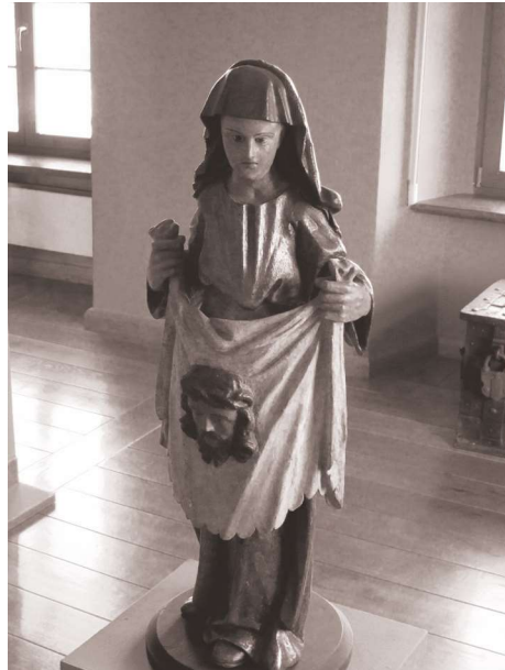
Fot. 8. Św. Weronika, pocz. XVI w., Muzeum Archidiecezjalne w Poznaniu

Postać św. Weroniki spotkać można także w zbiorach rodzimych. Za przykład posłużyć może poznańskie Muzeum Archidiecezjalne, które eksponuje rzeźbę pochodzącą z początku XVI w. przedstawiającą stojącą postać św. Weroniki prezentującą przed sobą chustę z bardzo plastycznie oddanym wizerunkiem Chrystusa (fot. 7 i 8).