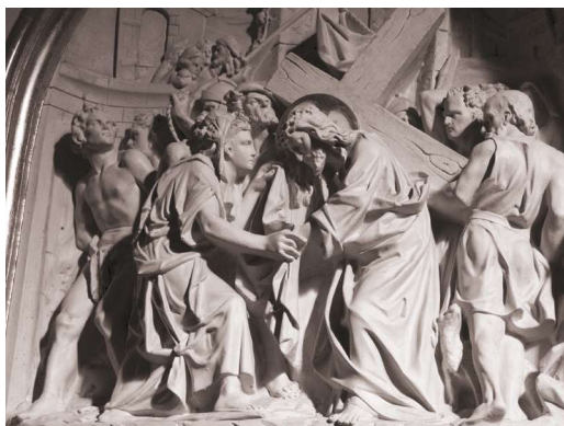
Fot. 3. Szósta Stacja Drogi Krzyżowej. „Weronika ociera twarz (Chrystusowi)”, Kościół o.o. franciszkanów w Poznaniu

poświęcone. Te praktyki ukrocił św. Karol Boromeusz motywując tym, iż jej imię nie figuruje w dawnych spisach męczenników ani we współczesnej Martyrologii Rzymskiej. Aktualnie uznawana jest za świętą w kościele katolickim, prawosławnym i ormiańskim. W kościele katolickim wspomniana jest liturgicznie 4 lutego lub 12 lipca. Warto dodać, że Weronika jest patronką praczek, gospodyń parafialnych, zedawców tkanin, szwaczek, tkaczy oraz od czasów współczesnych także i fotografów. Uchodzi ponadto za orędowniczkę w przypadkach poważnych obrażeń oraz krążenia krwi i dobrej śmierci.