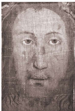
Fot. 5 Całun z Manoppello

cy wyodrębnionej wewnątrz jednego z czterech filarów podtrzymujących kopułę świątyni 1 . Przedfilarem zw. Kolumną Weroniki, stoi wniesiony monumentalny barokowy posąg św. Weroniki z chustą pochodzący z 1629 roku, dłuta Francesca Mocchi (fot. 4). Nad figurą znajduje się balkon, z którego w Niedzielę Palmową pokazywana jest wiernym święta relikwia. Twierdzi się, iż oryginał mógł zaginąć podczas najazdu cesarza Karola V na Rzym (tzw. Sacco di Roma 1527), a relikwia obecna może być jego kopią uważaną jedynie za oryginał, którym jednak mogła się stać dzięki wcześniejszemu dotknięciu świętego pierwowzoru. Oryginał chusty św. Weroniki utożsamia się niekiedy z tzw. całunem z Manoppello (fot. 5). Całun jest wykonany z bisioru – morskiego, bardzo delikatnego i niegdyś niezwykle drogiego, jedwabiu. W intensywnym świetle twarz Chrystusa na tkaninie wydaje się trójwymiarowa. Podobieństwo rzymskiej relikwii i całunu z Manoppello może potwierdzać teorię, iż jest on skradzionym w XVI w. oryginałem czyli prawdziwą Chustą Weroniki. Badacze ustalili niezwykle podobieństwo między trzema wizerunkami – rzymskim, z Manoppello i z Całunu Turyńskiego, co nasuwa przypuszczenie, iż jest to oblicze jednej i tej samej Osoby – Jezusa Chrystusa.