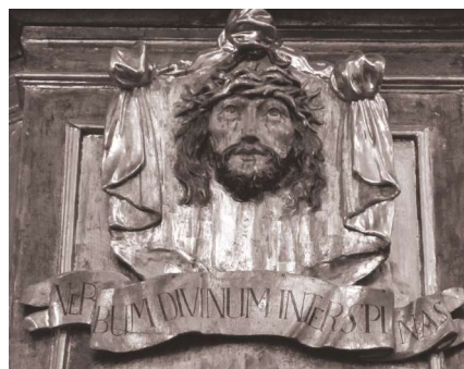
Fot. 2. Chusta św. Weroniki. Ambona w kościele o.o. franciszkanów w Poznaniu